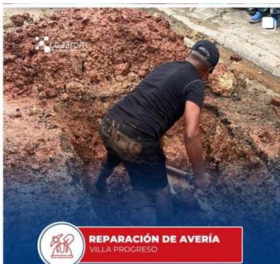
REPARACIÓN DE AVERÍA VILLA PROGRESO

Una Comisión del Consejo de la Corporación de Acueducto y Alcantarillado de La Romana, COAAROM se reunió en el despacho del general de la Policía Nacional, Juan Pablo Ferreira, para tratar temas relevantes relacionados con la transparencia y el buen manejo de los recursos de la entidad.