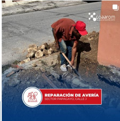
REPARACIÓN DE AVERÍA SECTOR PAPAGAYO, CALLE 3