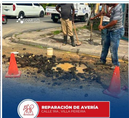
REPARACIÓN DE AVERÍA CALLE TRA, VILLA PEREIRA