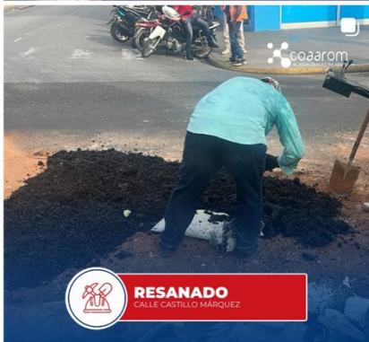
RESANADO CALLE CASTILLO MARQUEZ