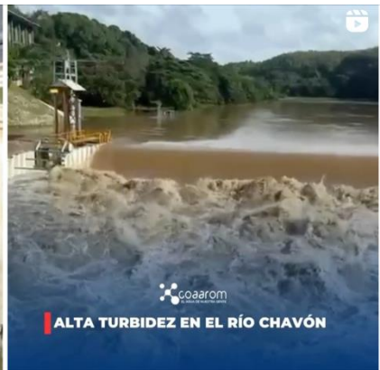
ALTA TURBIDEZ EN EL RÍO CHAVÓN