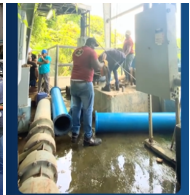
Mantenimiento en los motores de La Represa.