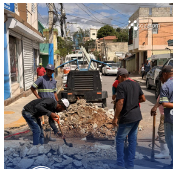
REPARACIÓN DE AVERÍA VILLA VERDE, CALLE GRANADIN CALLE VINCENZO DE BARRALÓN DE 30

Agradecemos la comprensión de los ciudadanos y reiteramos nuestro compromiso con la mejora continua del servicio.